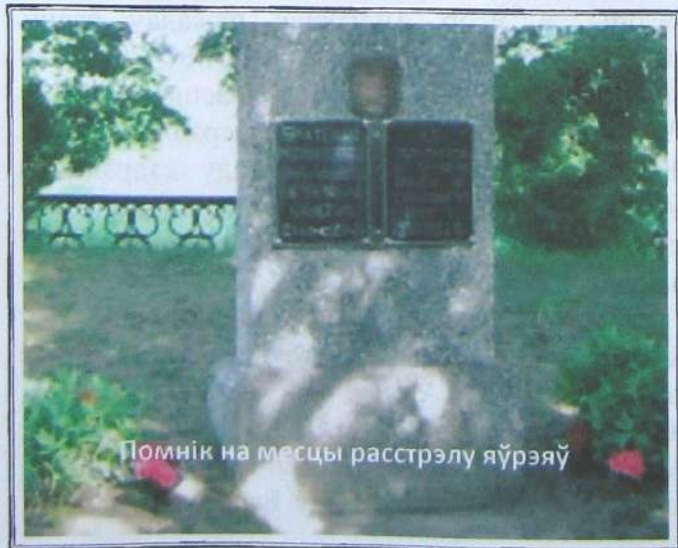
Помнік на месцы расстрэлу яўрэяў

Трагедыя Крукаўкі на гэтым не закончылася. Пазней там расстрэльвалі цыганоў.