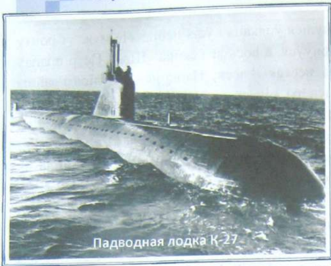
Падводная лодка К-27