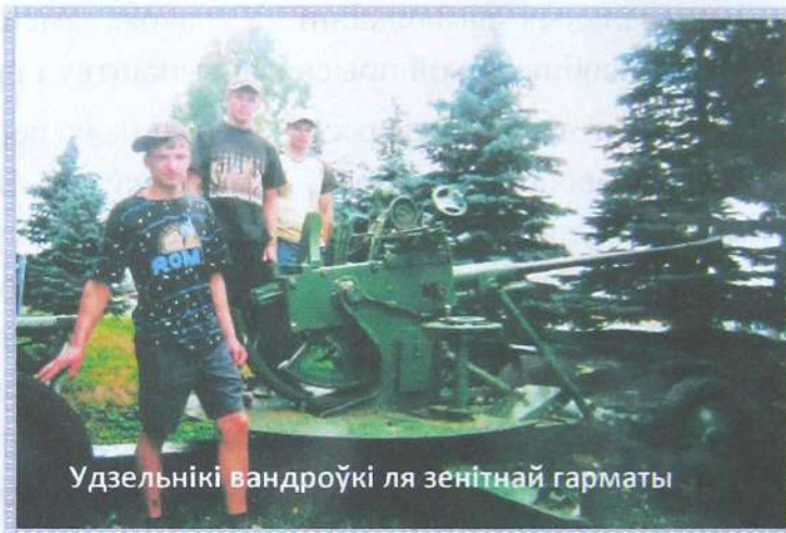
Удзельнікі вандроўкі ля зенітнай гарматы

З Кліменціем Арсенцевічам няспешна крочым па мястэчку, слухаючы змястоўны аповед аб мінулым знакамітага мястэчка Уважліва слухаем аб пошукавай дзейнасці і спыняемся ля зенітнай гарматы, якая ўстаноўлена побач са школай.